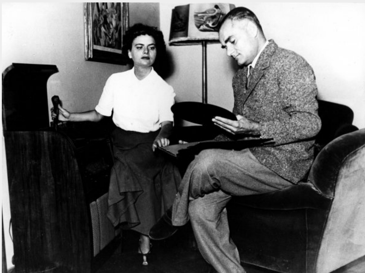
Moravia con Elsa Morante

In effetti, la malattia segna pesantemente il periodo della giovinezza del futuro scrittore, gli impedisce di frequentare regolarmente la scuola – è curioso ma l'unico titolo di studio di cui Moravia entra in possesso è il diploma di ginnasio, ottenuto da privatista – ma contribuisce forse in parte a far maturare in lui la vocazione letteraria. È proprio durante il periodo di degenza che dura ben cinque anni, due dei quali trascorsi in un sanatorio a Cortina d'Ampezzo, che Alberto si appassiona alla lettura e divora i grandi classici della letteratura, da Dostoevskji a Molière, da Shakespeare a Leopardi. Mentre si trova convalescente a Bressanone, nel 1925, inizia a scrivere il romanzo che pubblicherà tre anni dopo, a sue spese, o meglio a spese di suo padre, a cui chiede le cinquemila lire reclamate dall'editore. Si tratta de ' Gli Indifferenti ', ancora oggi uno dei suoi romanzi più conosciuti e letti, affresco della borghesia inquieta del suo tempo, su cui forse il giovane scrittore ha avuto modo di gettare uno sguardo privilegiato, dall'interno delle mura domestiche cui la malattia lo relega in quegli anni.