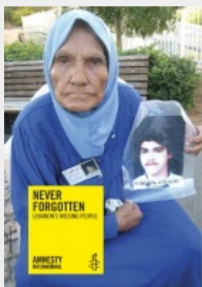
Libano – Sparizioni forzate

5 aprile – Tadjadine Mahamat Babouri , un blogger del Ciad conosciuto da tutti come Mahadine , è rilasciato su decisione dell'Alta Corte in quanto la sua detenzione preventiva aveva ecceduto i limiti previsti dalla legge. Era in carcere dal 30 settembre 2016 con le accuse di aver minacciato l'ordine costituzionale, l'integrità territoriale e la sicurezza nazionale nonché di aver collaborato con un movimento insurrezionalista, per le quali rischiava l'ergastolo.