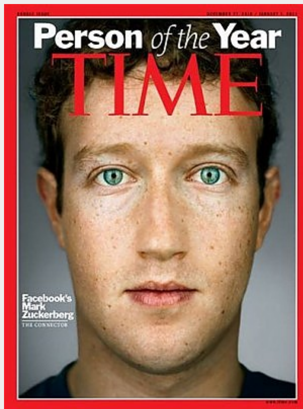
Mark Zuckerberg 'personaggio dell'anno' sul Time, nel 2010

A metà del 2004 Facebook ha già conquistato gran parte delle università di Stati Uniti e Canada, viene fondata la corporation Facebook, Inc. e i fondatori di Facebook si trasferiscono a Palo Alto in California, affittano una casa vicino all'Università di Stanford, ricevendo a fine mese il primo finanziamento. La strada è poi tutta in discesa, pur con qualche controversia giudiziaria. Tra aprile e agosto del 2005 viene registrato il dominio attuale, facebook.com, per la cifra di 200.000 dollari.