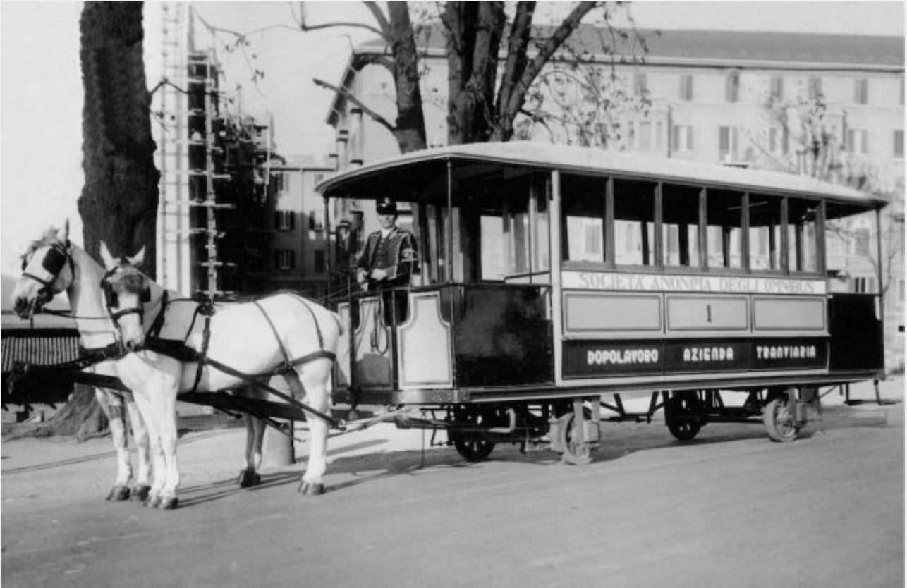
Un tram a cavalli della della Società Anonima degli Omnibus, ricostruito per una manifestazione del dopolavoro della ATM, Milano 1934

È un mezzo di trasporto che oggi apparirebbe quantomeno singolare, il tram a cavalli. Nel 1876, invece, era un simbolo del progresso industriale. Si tratta dell'evoluzione del già familiare (all'epoca) omnibus a cavalli: le vetture, trainate da cavalli, circolano ora su un binario, posto direttamente sulla sede stradale. Ciascuna può contenere tra le quaranta e le quarantacinque persone. La linea parte da porta Venezia, a Milano, e giunge a Monza in Largo Mazzini. Dal 1883 il nuovo capolinea monzese verrà poi fissato all'Arengario.