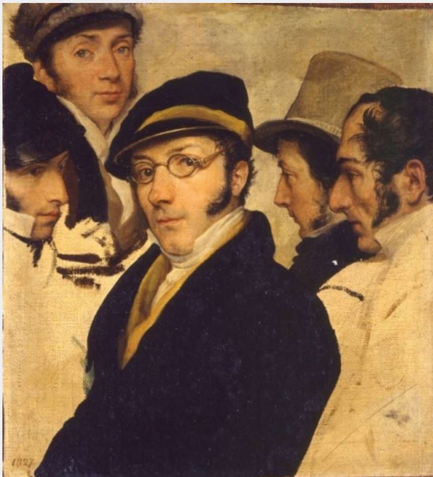
Francesco Hayez , Autoritratto in gruppo di amici , 1827