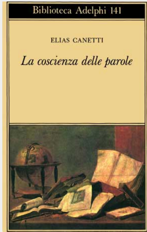
In copertina: David Teniers il Giovane, "Studio di oggetti" (1645-1650 ca.), Bruxelles, Musée Royal des Beaux Arts.

Molti degli autori in questo libro vennero pubblicati da Adelphi: Karl Kraus, Hermann Broch, Franz Kafka, Georg Büchner, Confucio e l'epopea mesopotamica di Gilgamesh, oltre allo stesso Canetti naturalmente. Per questo “La coscienza delle parole” è un libro, in cui gli estimatori della casa editrice Adelphi si sentiranno a casa.