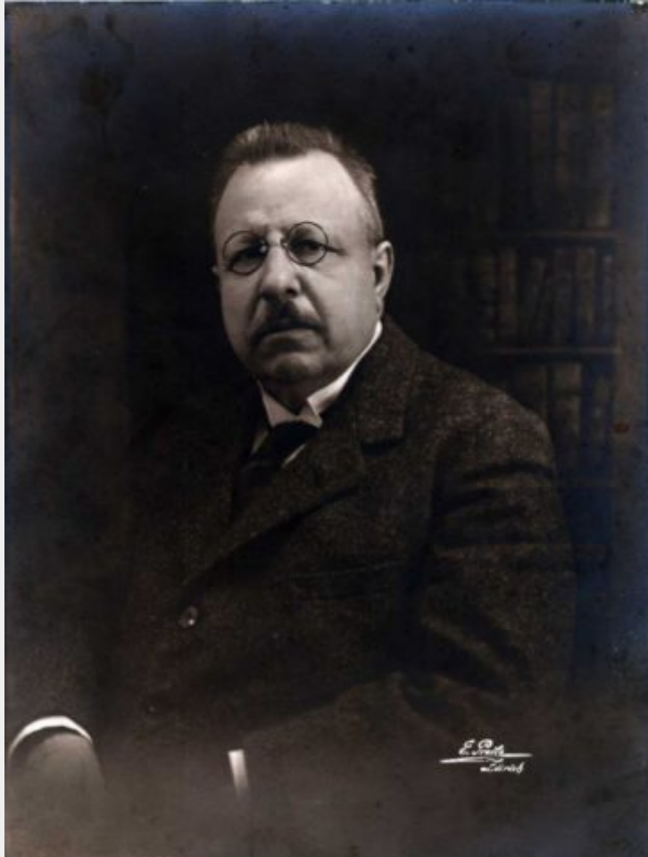
Il filosofo e politico Benedetto Croce (Pescasseroli, 1866 – Napoli, 1952) nella sua biblioteca.

“Mi conforta il pensiero che Lei stia a cuore il destino del Suo bel Paese straziato ancora dai suoi truci oppressori di dentro e di fuori. Lei pare predestinato a rendere un servizio inestimabile al Suo paese. Lei è uno dei pochissimi che abbiano saputo mantenersi al disopra della mischia dei partiti e in conseguenza ha la fiducia di tutti...”