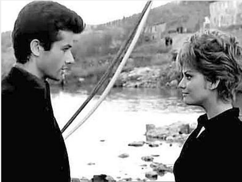
George Chakiris e Claudia Cardinale in 'La ragazza di Bube', film tratto dal romanzo di Cassola e diretto da Luigi Comencini nel 1963

Al di là delle critiche degli intellettuali, però, La ragazza di Bube ha un vastissimo successo di pubblico, Luigi Comencini ne trae il film omonimo e soprattutto si crea un forte movimento di opinione che porta nel 1961 alla liberazione dal carcere di 'Bube', ovvero Renato Ciandri, alla cui figura il romanzo è ispirato. Le ottime vendite dei romanzi successivi – da Il Cacciatore a Paura e tristezza – se da un lato rendono Cassola uno degli scrittori più amati dai lettori, dall'altro non gli fanno certo guadagnare le simpatie dell'élite culturale rappresentata dalla Neoavanguardia, che tende a considerarlo un autore 'facile', commerciale diremmo noi.