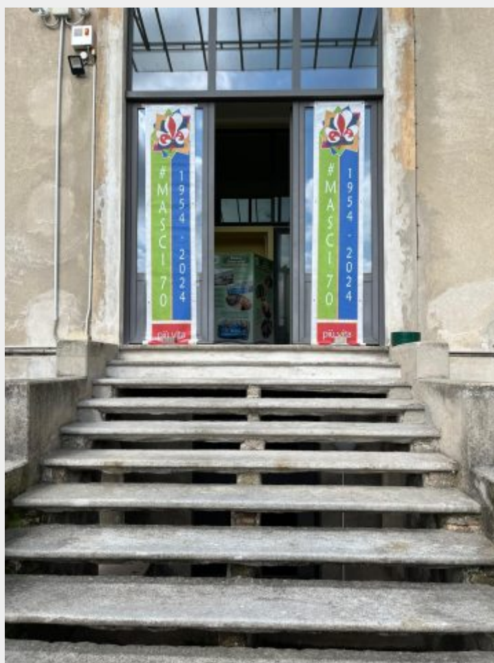
Ingresso della mostra

Una storia di attivismo ed educazione, di esperienze di crescita collettive e personali. Arriva a Monza la mostra itinerante dedicata ai 70 anni del Maschi , Movimento Adulti Scout Cattolici Italiani, che sarà allestita nella giornata di domani 26 aprile nei locali della biblioteca del Carrobiolo .