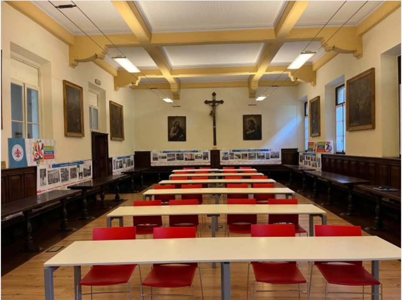
La biblioteca del Carrobiolo, in cui è allestita la mostra

Nello stesso anno sono poste anche le basi del percorso che porterà alla costituzione del Masci: Mario Mazza, già commissario Asci, riprende i contatti con i vecchi capi scout e riattiva lo scoutismo cattolico coinvolgendo anche gli adulti. Un'avventura, iniziata in clandestinità, che vede il proprio compimento il 20 giugno 1954, alla Domus Pacis di Roma, quando ad opera di 30 compagnie, per oltre 600 adulti scout, avviene la fondazione ufficiale del Movimento Adulti Scout Cattolici Italiani, di cui lo stesso Mario Mazza diventa il primo presidente.