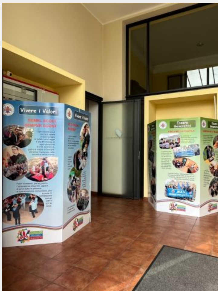
Un'immagine della mostra