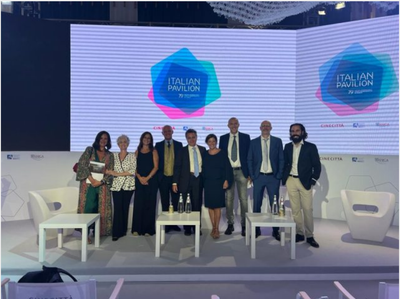
Il team de La Meridiana e di Libero Produzioni che hanno organizzato la presentazione di Rosa a Venezia