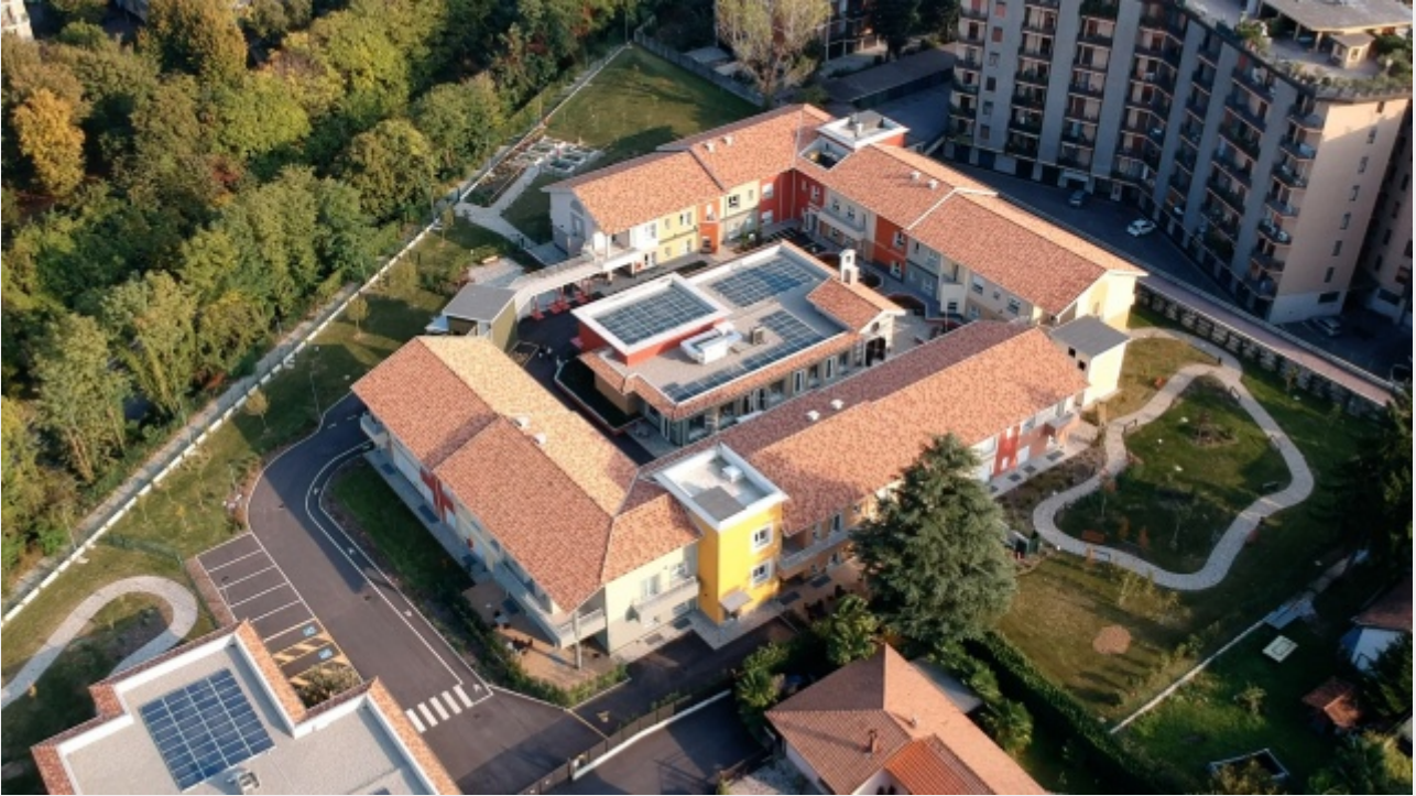
Il Paese Ritrovato, il borgo che ospita persone con Alzheimer

Un luogo dove le persone con demenza sono libere di scegliere cosa fare del proprio tempo e ritrovano una dimensione di socialità che restituisce valore alla loro vita.