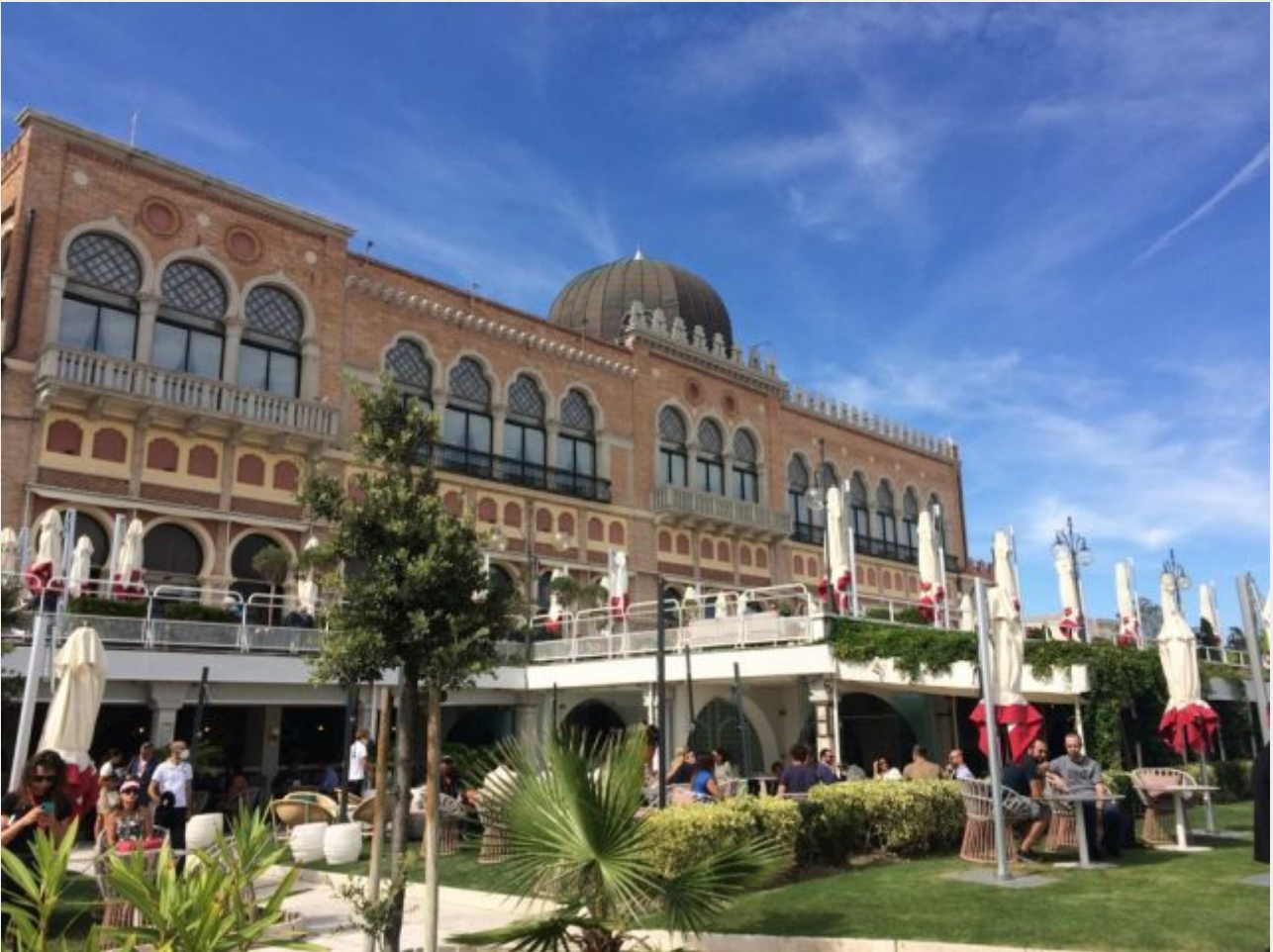
Lido di Venezia. L'Hotel Excelsior, il "tempio" della cinematografia internazionale