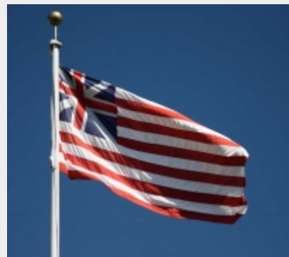
La Grand Union Flag

La bandiera ha avuto 28 varianti: la più recente è del 1960 con l'ingresso delle Hawaii.