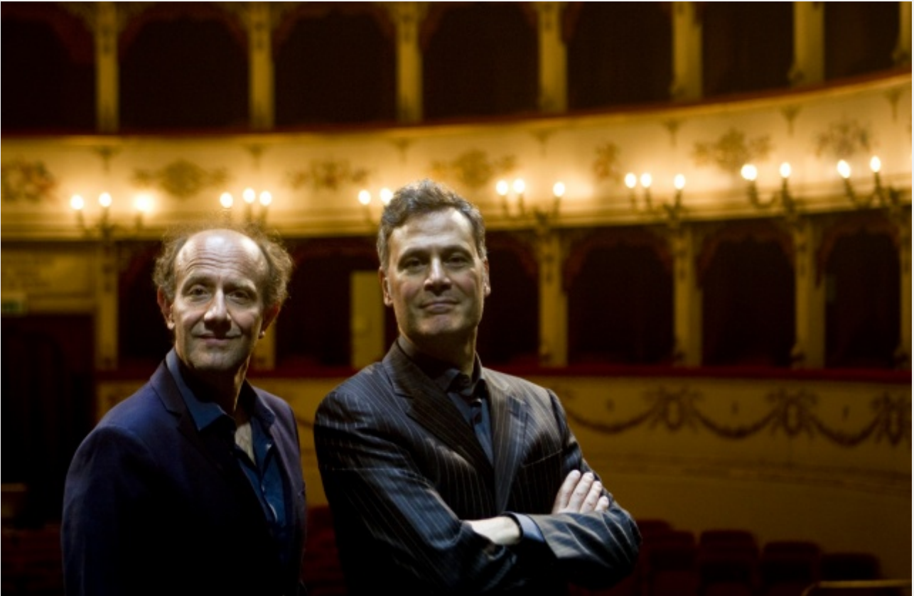
Ale e Franz

Di seguito riportiamo informazioni e tempistiche sulla campagna abbonamenti: