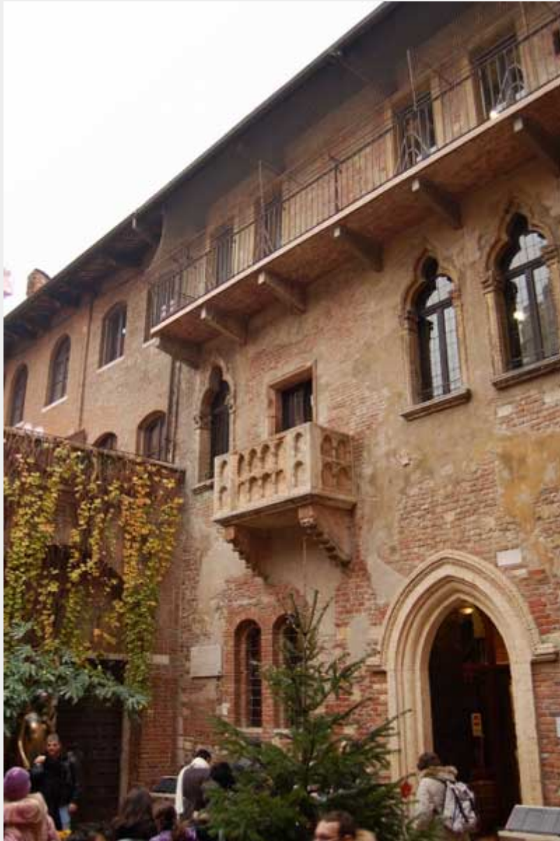
il balcone di Giulietta

L'ambientazione veronese della vicenda si deve ad un altro prosatore, vissuto un secolo più tardi, il vicentino Luigi Da Porto , che traspose quanto raccontato da Masuccio nella Historia nuovamente ritrovata di due nobili amanti , scritta nella villa che l'autore possedeva a Montorso Vicentino , dalle cui finestre poteva vedere le vicine colline di un altro paese, Montecchio Maggiore .