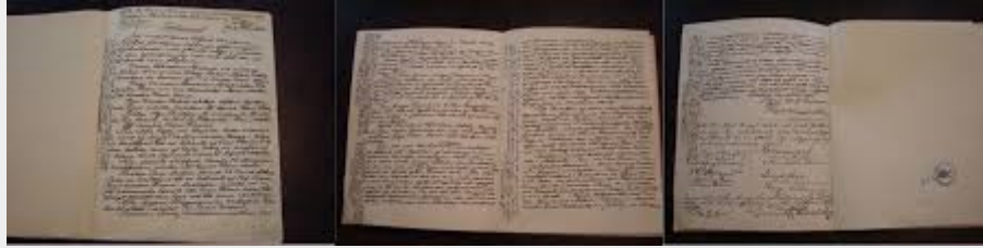
copia del testamento esposta a Villa Nobel, Sanremo

La totalità del mio residuo patrimonio realizzabile dovrà essere utilizzata nel modo seguente: il capitale, dai miei esecutori testamentari impiegato in sicuri investimenti, dovrà costituire un fondo i cui interessi si distribuiranno annualmente in forma di premio a coloro che, durante l'anno precedente, più abbiano contribuito al benessere dell'umanità". [...]