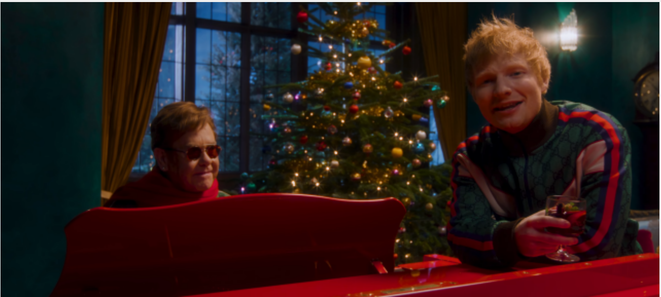
Elton John insieme a Ed Sheeran ha inciso il singolo per beneficenza Merry Christmas

La generosità s'illumina a festa a Natale il giorno dell'amore universale. In coppia con Ed Sheeran ha inciso il singolo per beneficenza Merry Christmas "ogni bambino dovrebbe avere un regalo sotto l'albero".