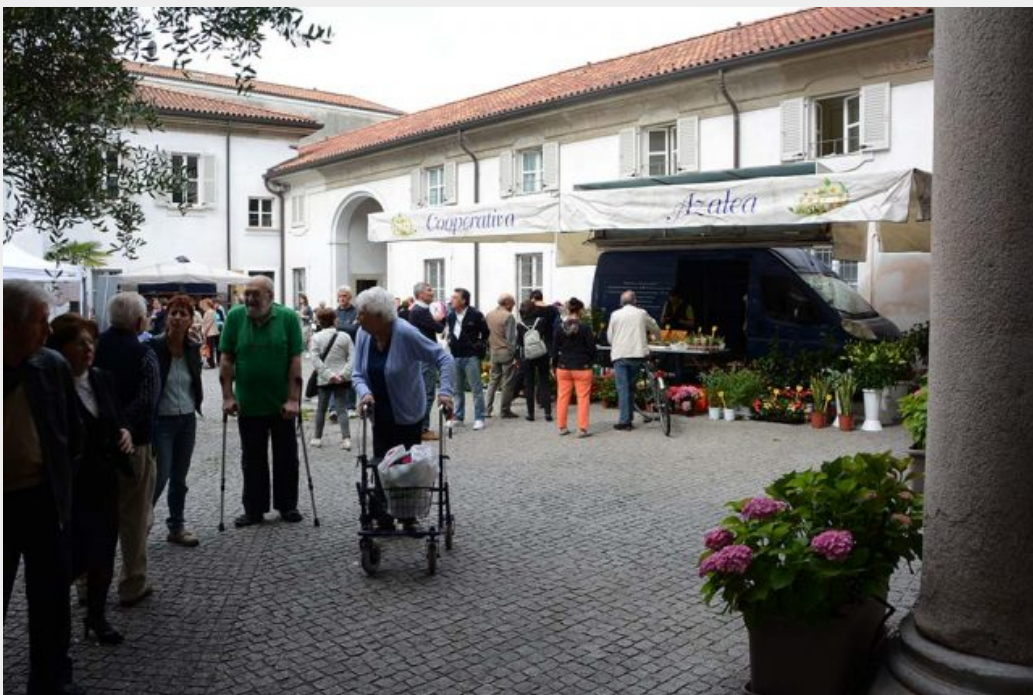
Stand informativi e laboratori creativi di associazioni del territorio invitati da la Cooperativa Sociale La Meridiana e dal Consorzio Comunità Brianza.