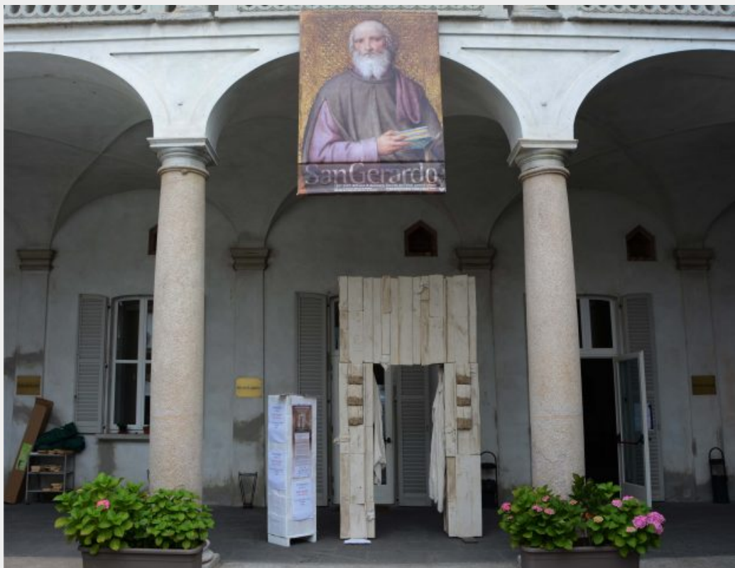
La "Porta del dialogo" raggiunge l'Oasi San Gerardo, IV tappa del suo cammino. Questo stupendo edificio, del 1170, fu un tempo la casa di San Gerardo.