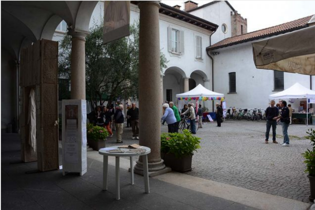
Persone in visita all'Oasi San Gerardo.