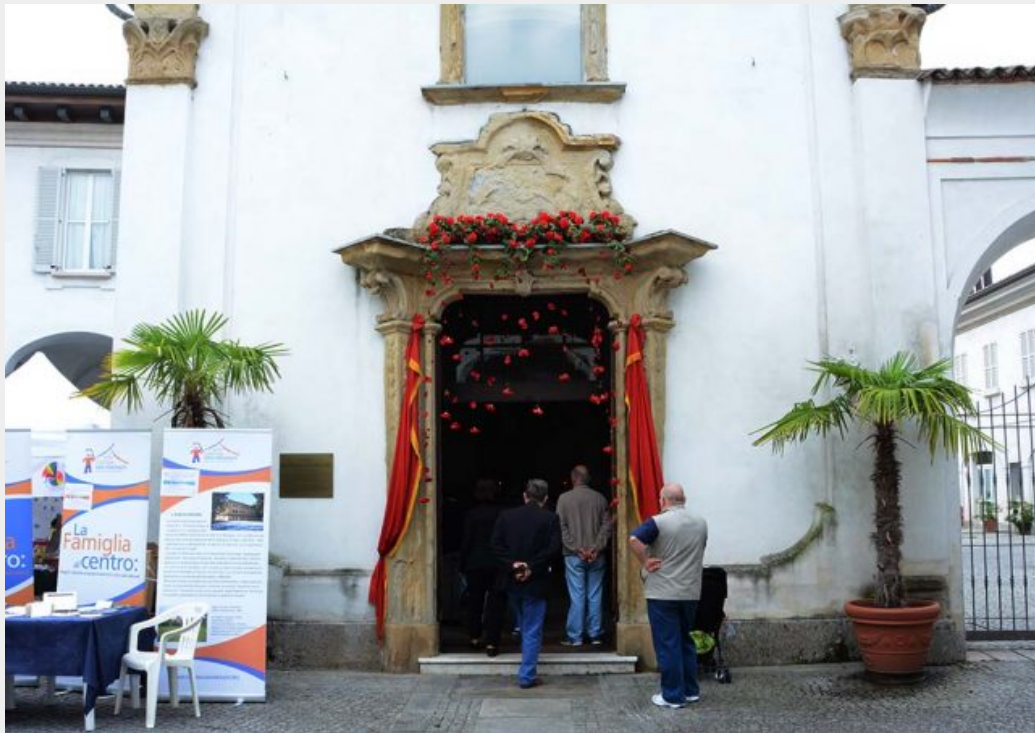
La piccola chiesa di San Gerardo intramurano, detta di San Gerardino, di origine cinquecentesca, addobbata per la festa.