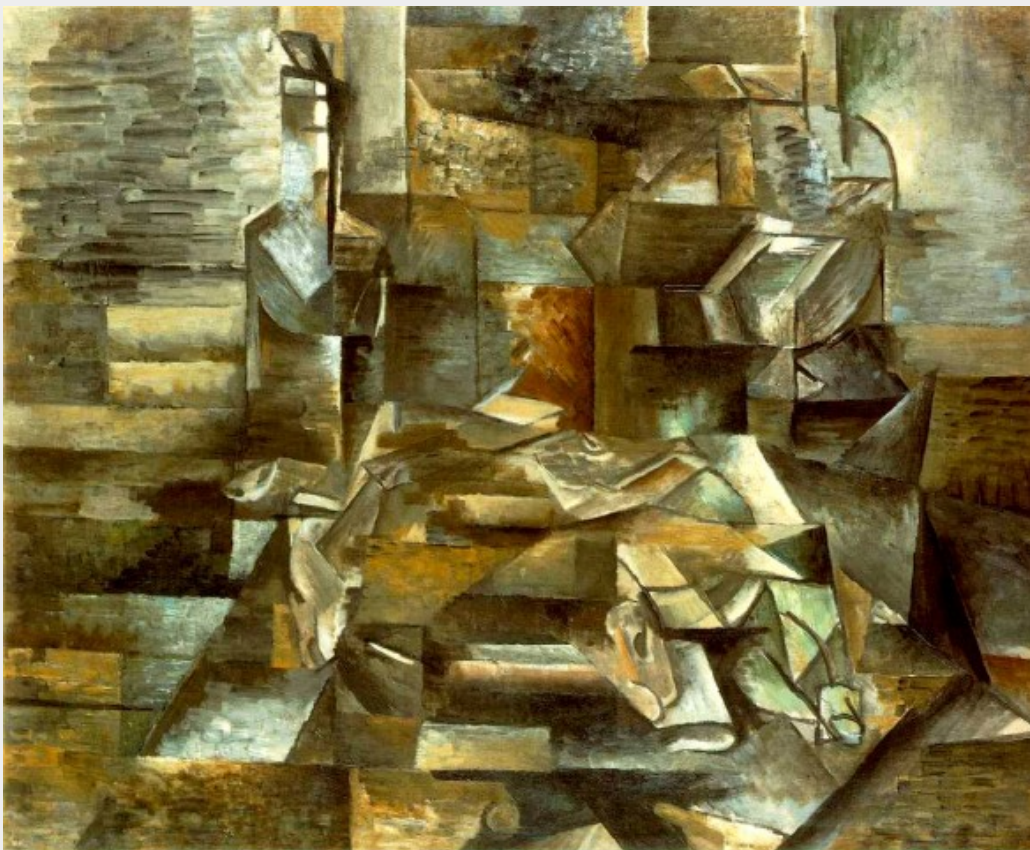
Bottiglia e pesci – 1910-12

Cinquantadue anni fa, a Parigi, il 31 agosto 1963 moriva Georges Braque , uno dei padri dell'Arte moderna. Era nato a Argenteuil nel maggio del 1882. Argenteuil era un luogo amato dai primi pittori impressionisti e gli esordi risentono di quell'esperienza anche se già dal 1904 si orientò verso il Fauvismo. I ribelli e selvaggi Fauves , questa la traduzione dal francese, erano più vicini allo spirito di Georges esattamente come Cezanne con i suoi paesaggi pre-cubisti, una sorta di prologo al movimento che Braque fondò con Pablo Picasso .