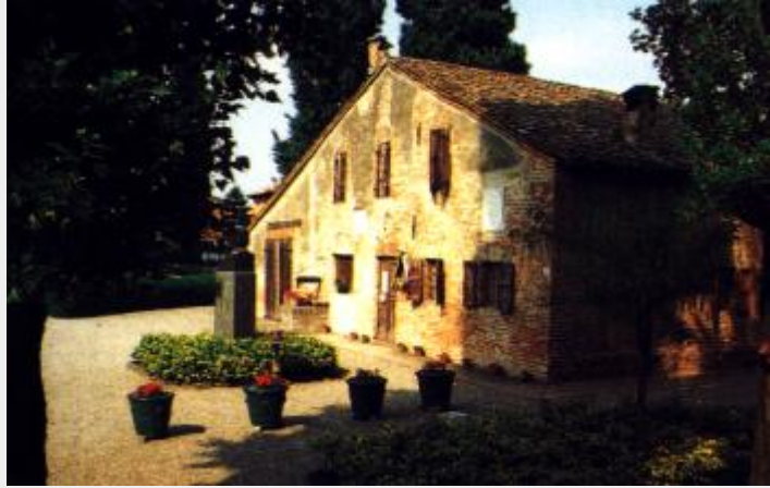
La casa natale di Verdi a Roncole di Busseto

Sono le sue stesse parole a ridimensionare la faccenda, confesserà infatti di avere accettato l'incarico come Deputato nel Parlamento del Regno di Sardegna (che nel giro di pochi mesi diventerà Parlamento del neonato Regno d'Italia) a condizione di potersi dimettere nel giro di poche settimane, e del resto il fatto di non avere mai partecipato attivamente ai lavori del Senato dove entra nel 1874 su nomina regia (non era elettiva la camera alta) è a riprova di una personalità lontana dall'agone politico.