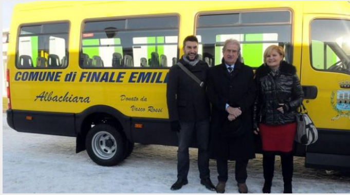
il bus per i bambini di Finale Emilia

La beneficenza può arrivare anche da un'aula di tribunale "negazionisti squilibrati, vi querelo e do tutto in beneficenza... io la mascherina la metto anche sulle mani...".