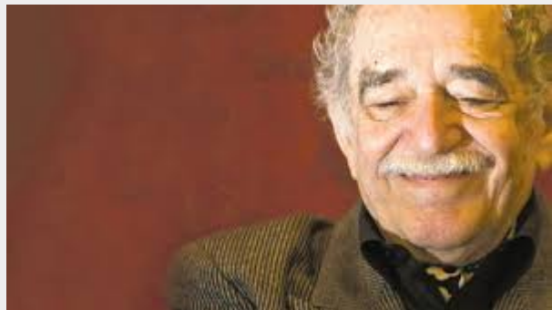
Gabriel Garcia Marquez

La demenza nel mondo ha assunto dimensioni pandemiche. Il Rapporto Mondiale Alzheimer 2015 stima una presenza di 46,8 milioni di persone affette da demenza nel mondo, con una media di oltre 9,9 milioni di nuovi casi ogni anno. Le proiezioni indicano in 74,7 milioni nel 2030 e a 131,5 milioni nel 2050 il numero complessivo di persone colpite dalla malattia. In Italia le persone malate di demenza sono circa un milione. Gli studi demografici prevedono che nel 2050 le persone malate di Alzheimer e di demenza saranno quadruplicate. In Lombardia sono circa 80 mila le persone malate di Alzheimer o che soffrono di una qualche forma di demenza senile, rappresentando il 13% dei malati di Alzheimer presenti nel nostro Paese. Nel solo territorio dell'ATS Monza e Brianza le persone con demenza sono 7.300 pari al 4,5% di tutta la popolazione anziana (dati Invalidità Civile).