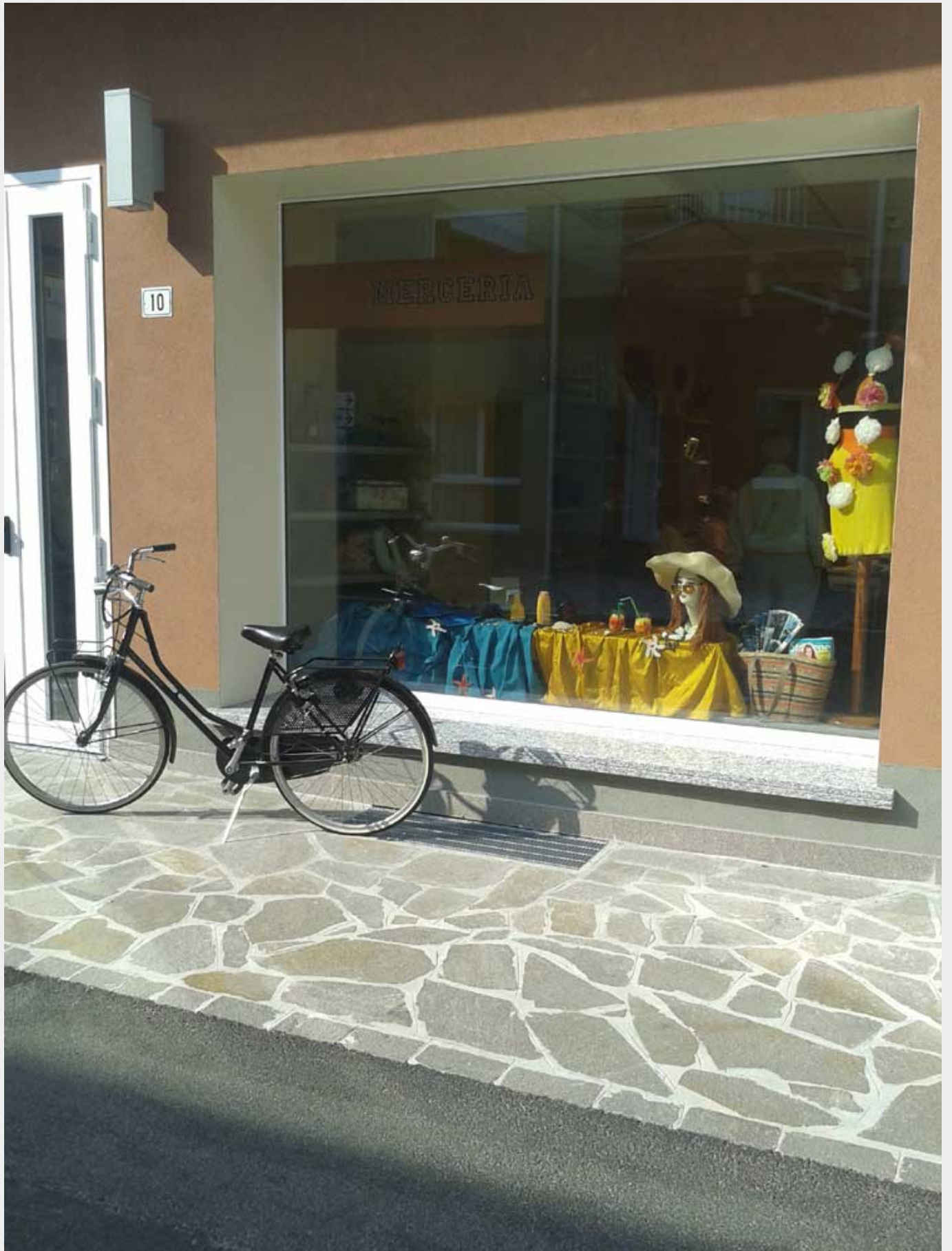
La vetrina della sartoria