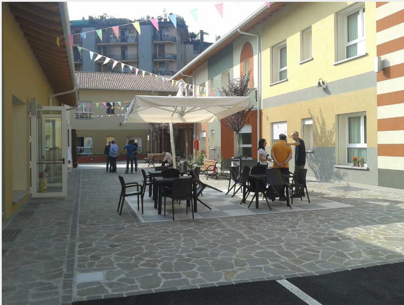
Il Paese Ritrovato, il borgo che accoglie persone con demenza

malattia della demenza. Eppure qui, a Monza, la Cooperativa La Meridiana ha pensato di rispondere a questa drammatica malattia con un ingegnoso stratagemma. Ispirati da alcune esperienze olandesi, il team di Meridiana ha pensato che un borgo, un piccolo villaggio, potesse rappresentare una risposta all'Alzheimer. Trovati i finanziamenti, La Meridiana, nel giro di poco più di un anno e mezzo, ha costruito una cittadina: il Paese Ritrovato . Dal 25 giugno il villaggio ha aperto le sue porte e vi abitano 32 persone.