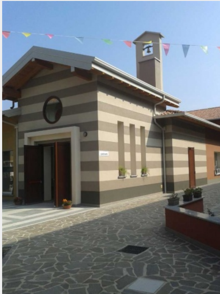
La chiesa del borgo dedicata ai santi Gioachino ed Anna

Si avverte il vuoto progettuale e anche di fantasia da parte della politica e dei partiti. La frase: “mancano le risorse” è ormai inflazionata e alla fin dei conti è divenuta un alibi per evitare sforzi e qualsiasi tentativo. L'invito alla classe politica è quello di far proprio l'aforisma di Agatha Christie: “solo perché un problema non è ancora stato risolto non è detto che sia impossibile da risolvere”