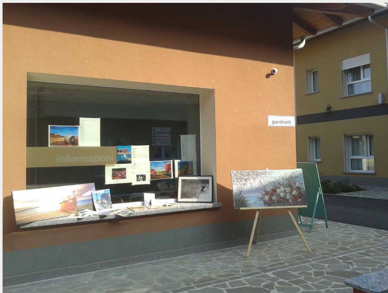
La vetrina della Pro Loco