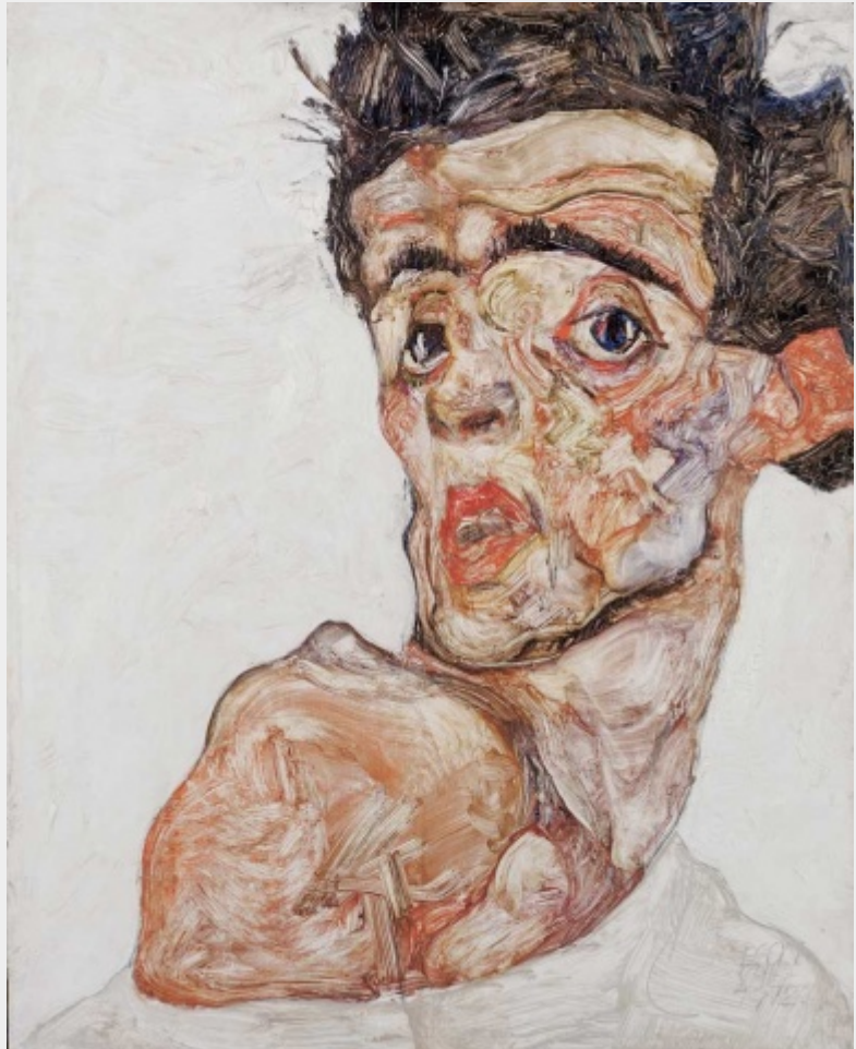
Egon Schiele – autoritratto