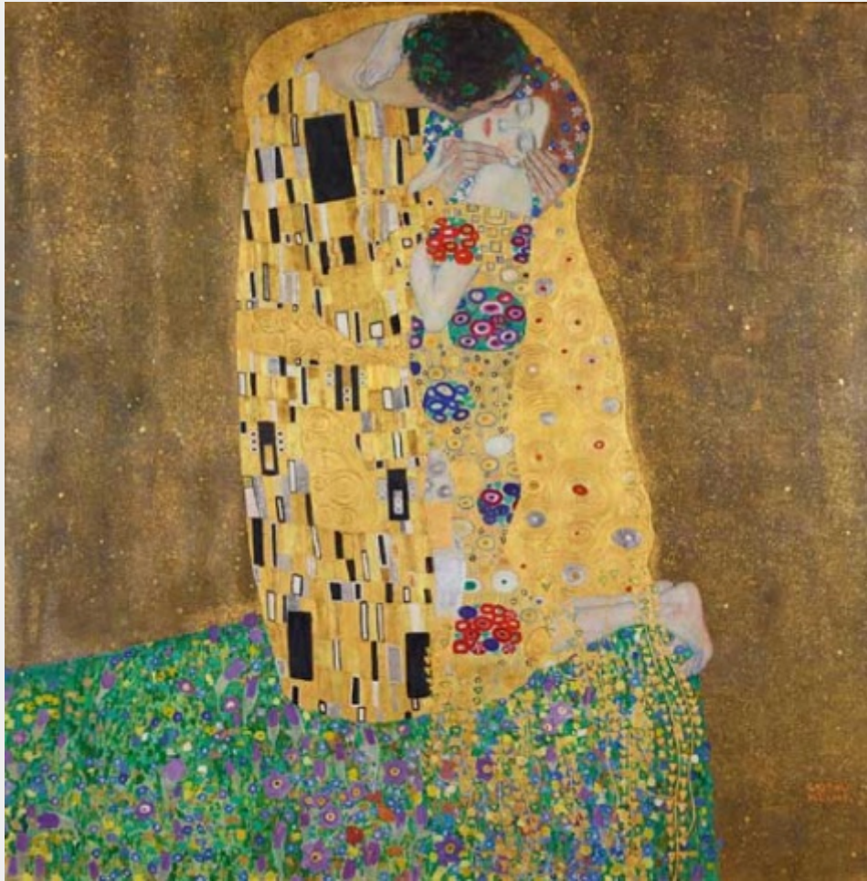
Gustav Klimt – il bacio

Oggi i loro capolavori attirano visitatori da tutto il mondo o diventano star al cinema in film come Woman in Gold , ma sono anche immagini pop che accompagnano la nostra vita quotidiana su poster, cartoline e calendari. Le opere di questi artisti visionari – tra Jugendstil ed Espressionismo – tornano protagoniste assolute nella capitale austriaca, insieme a quelle del designer e pittore Koloman Moser e dell'architetto e designer Otto Wagner, morti in quello stesso 1918.