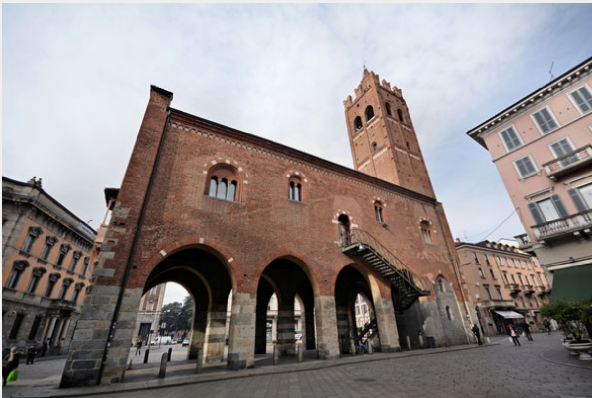
L'Arengario di Monza.

Ma ... non solo dibattiti e riflessioni: gli studenti coinvolgeranno i cittadini e i passanti a partecipare a giochi cooperativi e a conoscere più da vicino il mondo della cooperazione.