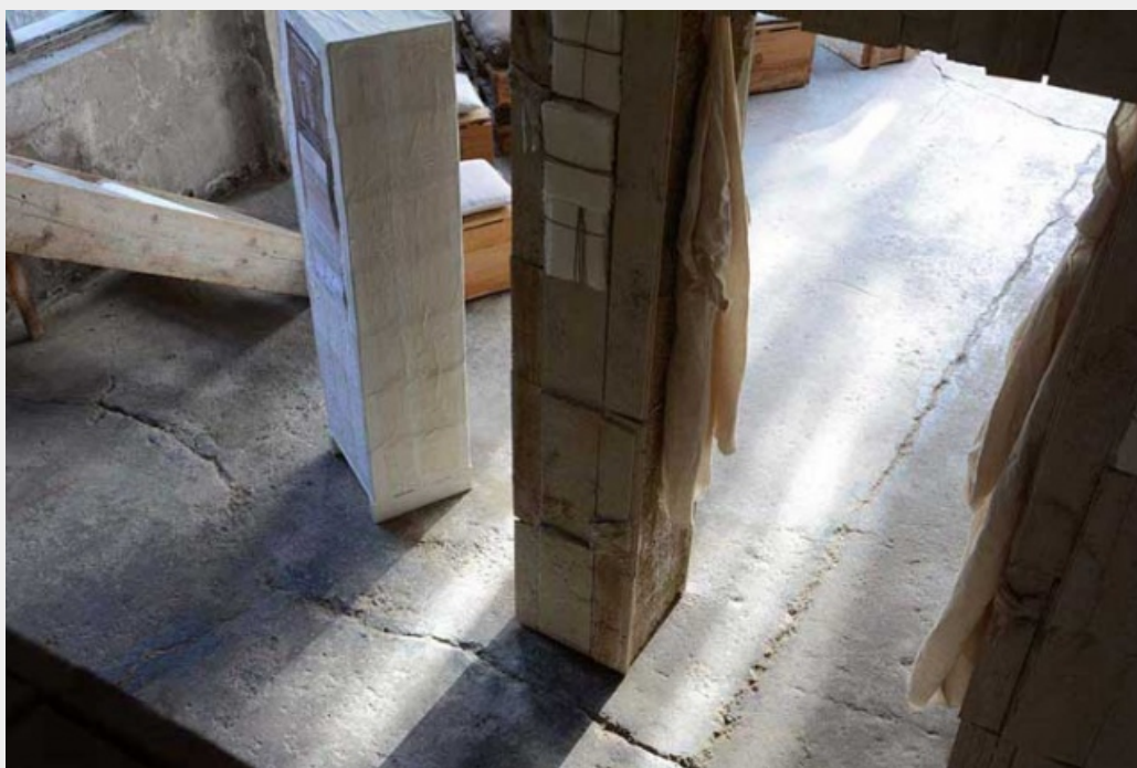
La Porta del Dialogo

Che è poi quello che, questo piccolo grande giornale che coraggiosamente naviga nell'oceano della rete con il suo carico di buone notizie (questo almeno è il suo sforzo), ha cercato di fare immaginando, ideando, realizzando 'La Porta del Dialogo', un manufatto d'arte nel quale si sono voluti concentrare idealità e passioni, sforzi e tentativi, volontà e speranze di un vivere migliore nell'oggi e più ancora nel domani.