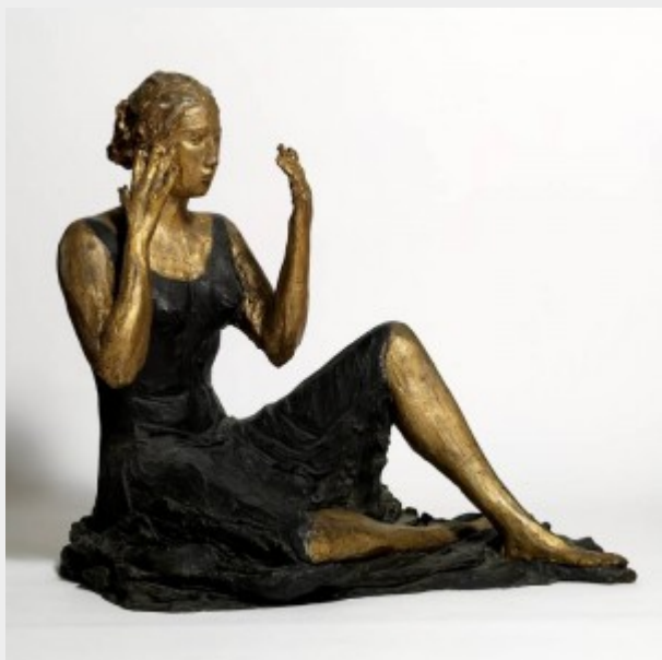
Lucio Fontana, Signorina seduta, 1934

Lucio nasce in Argentina perché lì si trovava il suo babbo, a sua volta scultore. Quando torna in Italia, coltiva l'amore per la scultura studiando con Adolfo Wildt .