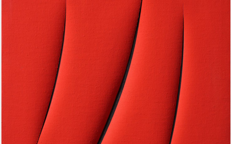
Lucio Fontana, Concetto Spaziale. Attese 1961

Forme nello spazio che vibrano, creano suggestioni e nuovi pensieri. Una moderna bellezza.