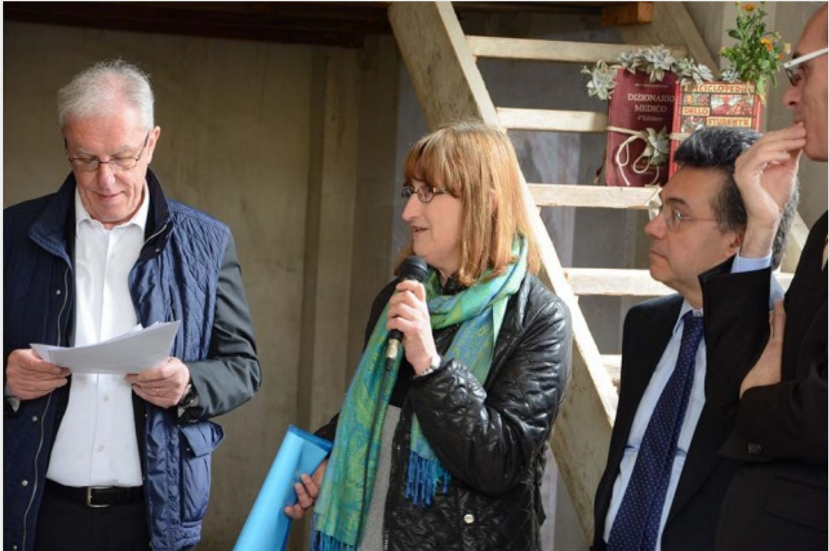
Concettina Monguzzi, sindaco di Lissone

A settembre, il 24, in occasione della Veglia interreligiosa per la Pace sarà all'Arengario. In ottobre, in collaborazione con l'Hospice Don Gnocchi e la Cooperativa Novo Millennio, la Porta del Dialogo raggiungerà la sede del PIME, il Pontificio Istituto Missionario Episcopale.