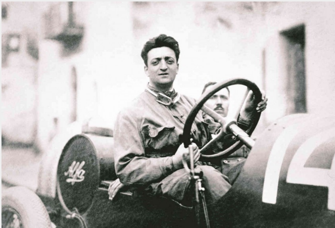
Enzo Ferrari con il meccanico Michele Conti. L'auto è una Alfa Romeo 20-40 HP (prima gara di Ferrari con l'Alfa: si classifica al 2° posto assoluto, 1° di categoria)

Anche il lavoro manuale gli piace, e spesso scende in officina a dare una mano a suo padre, che lo vorrebbe più studioso e lo immagina ingegnere. Un'infanzia e una adolescenza felici quindi. Purtroppo scoppia la Grande Guerra, che travolge tutto e tutti, anche chi è lontano dal fronte. Un'ombra scura cala sulla famiglia Ferrari.