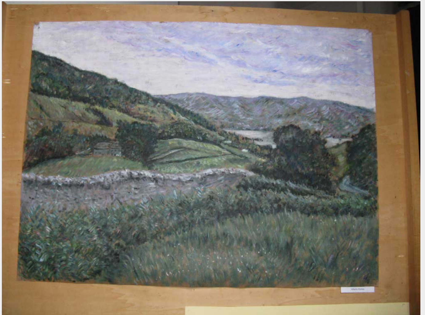
1890s - 1900s