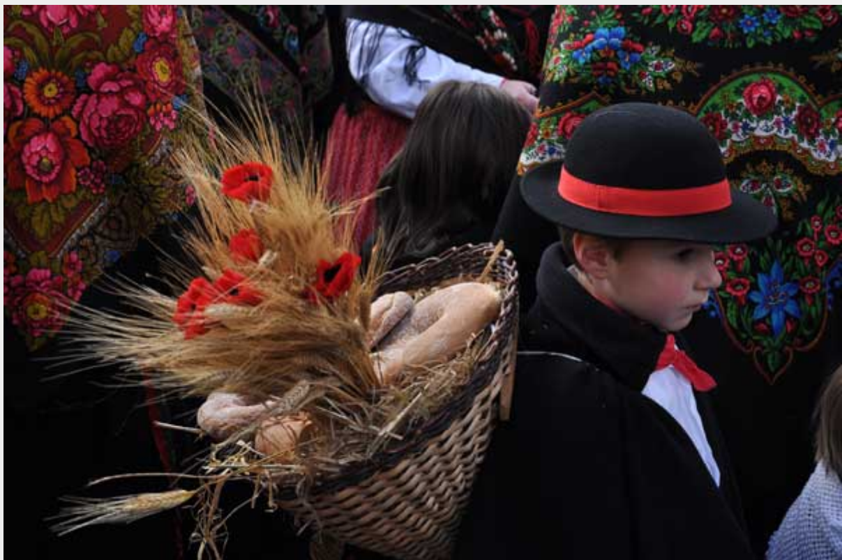
la tradizione sulle spalle

A Bormio il giorno di Pasqua si rinnova l'appuntamento con i "Pasquali", ovvero con una sfilata di portantine a tema religioso costruite dai giovani del paese nei mesi invernali. Fabbri, artigiani e semplici appassionati si radunano nei loro quartieri per cercare di creare il "Pasquale" più rappresentativo nel solco di una tradizione iniziata nel XVII secolo. La domenica di Pasqua gli uomini (chiamati per l'occasione "pasqualisti") portano in spalla le portantine mentre le donne completano la sfilata con fiori e piccoli prodotti artigianali. Una giuria formula una classifica tenendo conto di più fattori: dal significato religioso al lavoro artigianale senza dimenticare l'aspetto culturale. Conclusa la sfilata i "Pasquali" restano in esposizione in piazza del Kuerc fino al lunedì di pasquetta. Info: www.bormio.eu